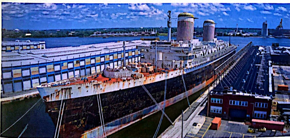
ss UNITED STATES - In Philadelphia Pier 82

te werven om het schip op te knappen en te behouden als publieksattractie, maar gezien de deplorabele staat waarin het verkeert, is dat niet gelukt. Dat is wel het geval met de Queen Mary , het schip waarvan in 1952 de Blauwe Wimpel werd afgetroefd. Die ligt als hotelschip in Long Beach bij Los Angeles. Eind 1967 werd zij verkocht en maakte de driepijper haar laatste reis naar Californië, waar zij werd gerenoveerd. Frappant genoeg hebben dus de laatste twee Blauwe Wimpeldragers kans gezien de sloopdans te ontspringen.