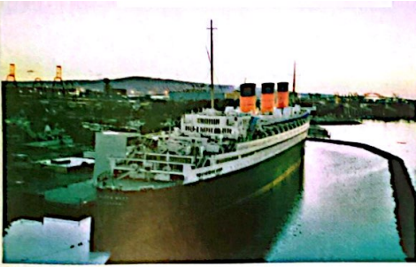
ss QUEEN MARY - Long Beach (nog in gebruik)