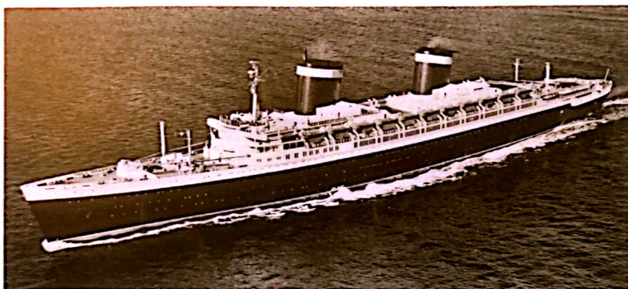
ss UNITED STATES - vanuit de lucht

In de gouden tijd van de oceanstomers was de Blauwe Wimpel een felbegeerde trofee, die trots werd gevoerd door het passagierschip dat de trans-Atlantische overtocht het snelst aflegde. In juli 1952 werd het record voor het laatst verbeterd en kwam de wimpel in handen van het ss United States, ook bekendstaand als 'The Big U'.