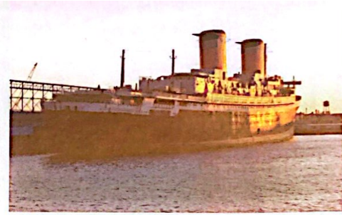
ss UNITED STATES aan de pier in Philadelphia

die het door Newport News Shipbuilding voor $78 miljoen gebouwde schip zwaar had gesubsidieerd, met als oogmerk er in oorlogstijd troepen mee te kunnen vervoeren. Het was nog in de tijd van de Koude Oorlog en het schip moest binnen 48 uur aangepast kunnen worden tot troepentransportschip voor 14.000 manschappen, terwijl er normaliter plek was voor 1.928 passagiers en 900 bemanningsleden.