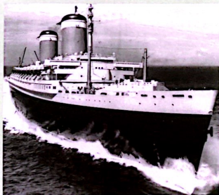
Volle kracht vooruit

oversteek maakte met 31,69 knopen en terug met 30,99 mijl per uur. De Engelsen op hun beurt hadden een jaar daar-